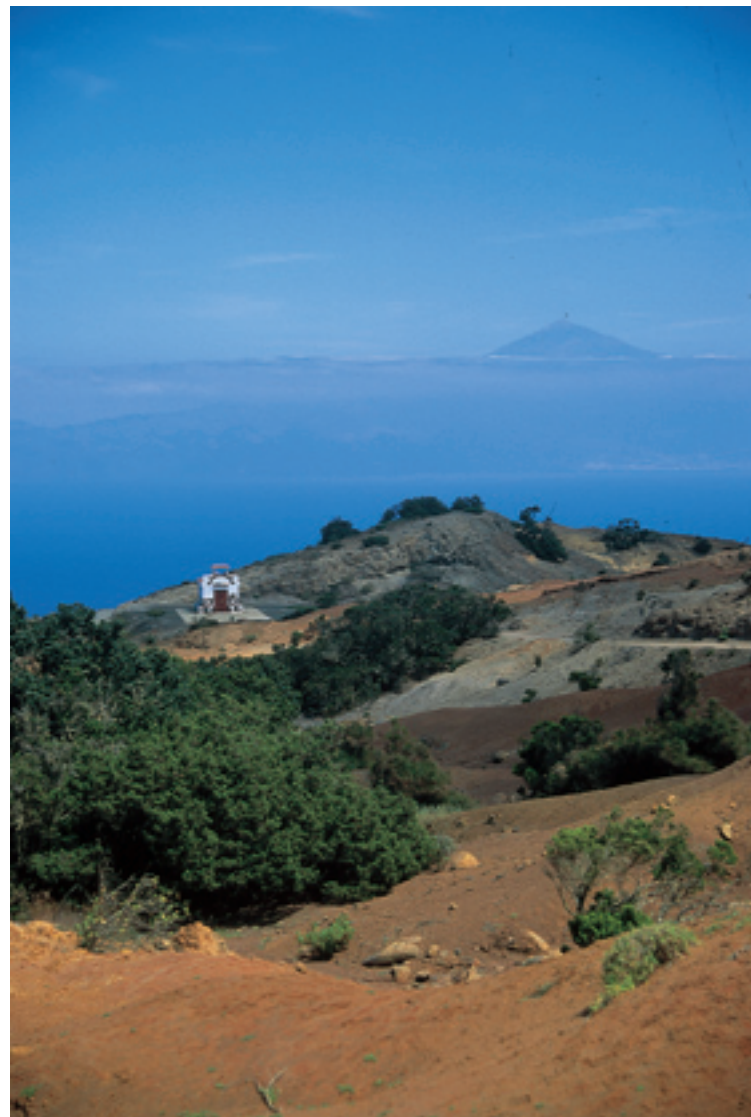
Vi är uppe på bergskammen mellan Vallehermoso och Los Organos. Det vitmålade Ermita de la Virgen de Guadalupe (någon karta säger Ntra. Sra. de Coromoto) ligger vackert i det annars färgrika landskapet med Teide i bakgrunden.

Stigen följer bergskammen genom låg vegetation och är redan mer spännande än de första 20–30 minuterna. Du ser både Roque El Cano, Vallehermoso, skogen och höjdkammarna mot Garajonay, om de inte göms i dimmolnen. Vi hade moln på väg upp och sol på väg ner,