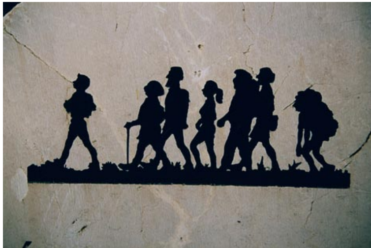
På vandring på Mallorca. Från en av stenstolparna längs stigen mellan Lluc och Caimari (se sidan 225).

Oppegård, januari 2008 Anita och Birger Løvland